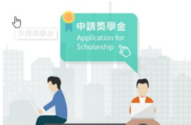
圖 6 申請獎學金