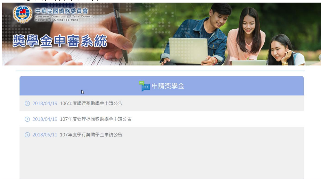
圖 7 獎學金列表