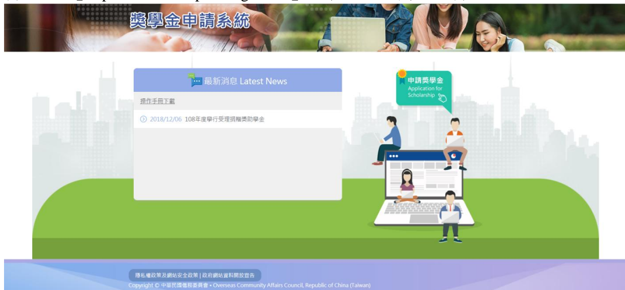
圖 1 系統首頁

輸入網址【 https://scholarship.ocac.gov.tw/ 】，即可進入到系統首頁