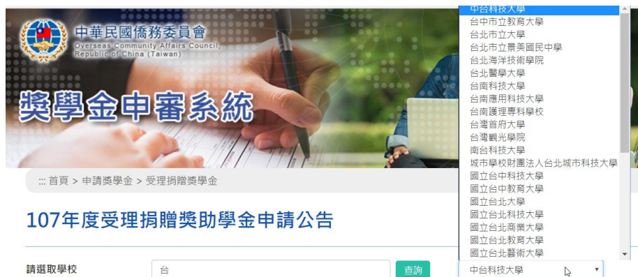
圖 16 搜尋並選取學校名稱