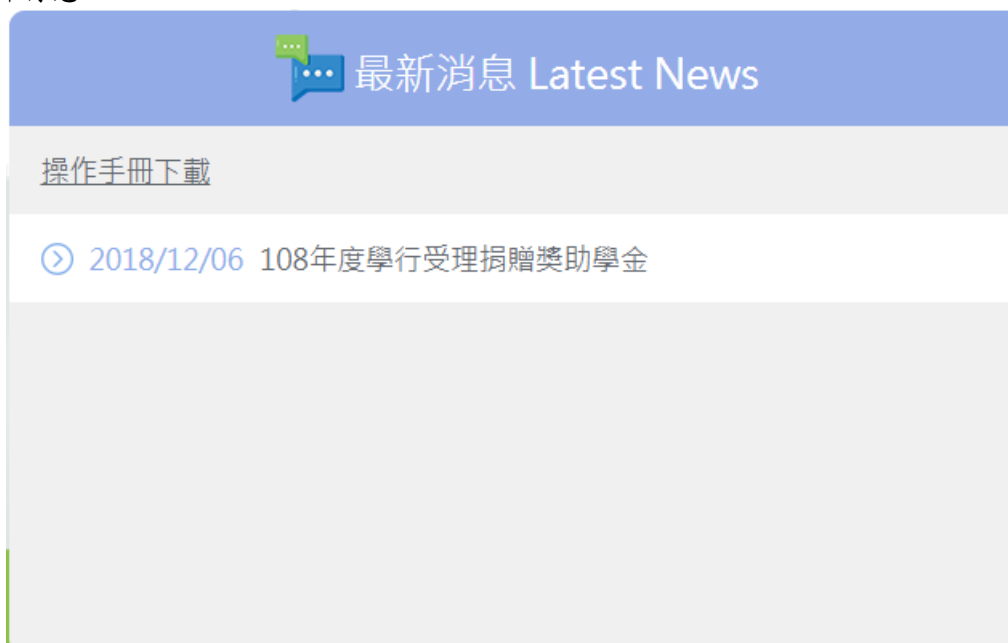
圖 2 最新消息