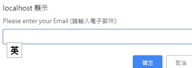
圖 13 輸入【Email】