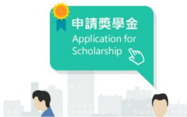
圖 3 申請獎學金入口