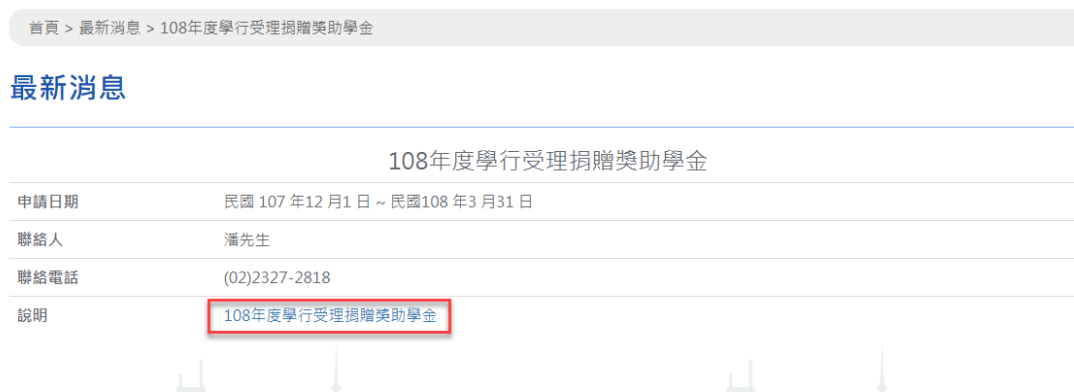
圖 5 獎助學金簡介

選取想要申請的獎助學金，可看到獎助學金的簡介。 點選說明可直接進入獎助學金報名畫面。