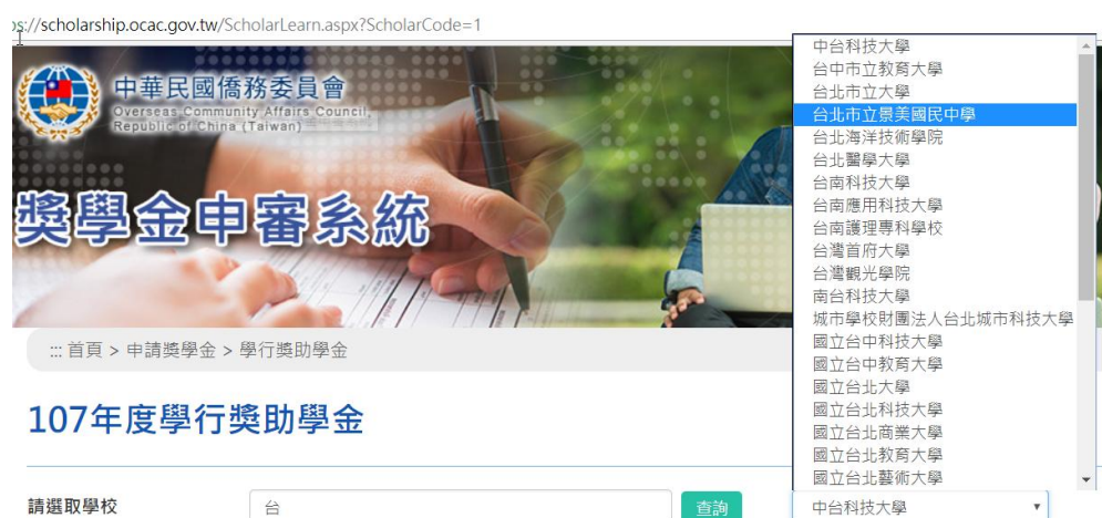
圖 8 搜尋並選取學校名稱