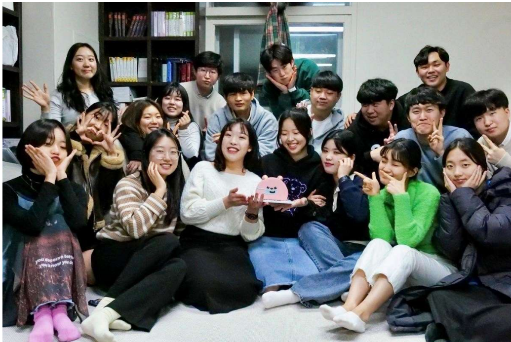
離開韓國前，韓國朋友們為我們舉辦的歡送會

第一次不是以旅遊，而是以交換學生的身分到國外，不再是以觀光旅遊的想法看待韓國，而是細細地觀察著所有人、事、物，從中去學習韓國的特有文化、去了解並尊重，在韓國的後半年也因為疫情政策的放寬，原本已逐漸小落寞的區域因為外國遊客的到來，又重新熱絡起來，對於韓國的觀光經濟也是一大幫助。回到臺灣以後，我仍會持續努力地學習韓文，並與韓國朋友們保持聯絡，讓這得來不易的一年中所學的不因時間流逝而逐漸忘記，而是持續給自己設定目標，鼓勵自己繼續向前。