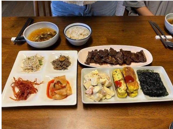
朋友邀請我們到家吃家常菜

食：韓國食物大多偏重鹹重辣，會習慣在飲食中加入辣椒粉，在有的料理中也會加糖來提升甜味，到餐廳用餐時也都會提供各式各樣的小菜，每個人家中也幾乎會有一個泡菜冰箱，從這裡可以了解到韓國小菜文化的盛行。