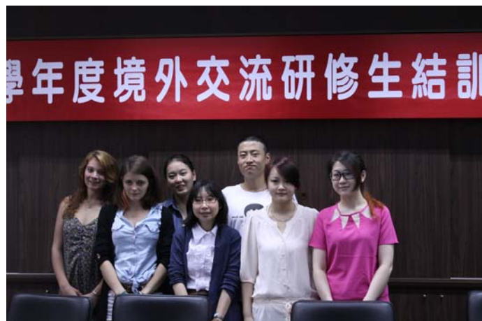
101 年度全體境外研修生合影