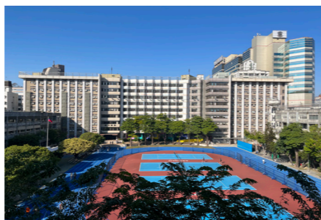
學生宿舍及運動場