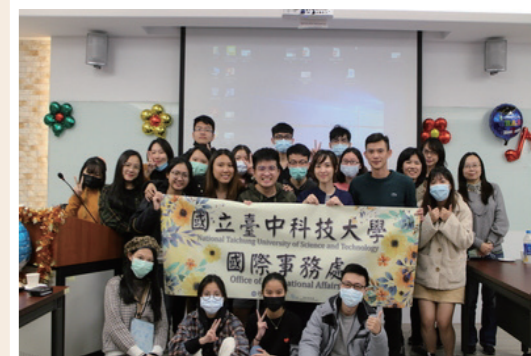
生活華語課程結業式