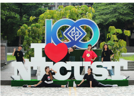
百年校慶裝置藝術