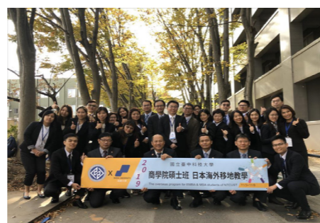
商學院碩士班日本海外移地教學