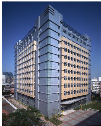
商學院綜合教學大樓