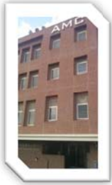
教室（きょうしつ）AMCの4Fです！

大阪府大東市（おおさかふ だいとうし）大阪産業大學（おおさかさんぎょうだいがく）