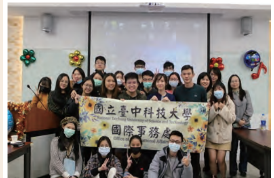
生活華語課程結業式