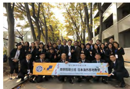
商學院碩士班日本海外移地教學