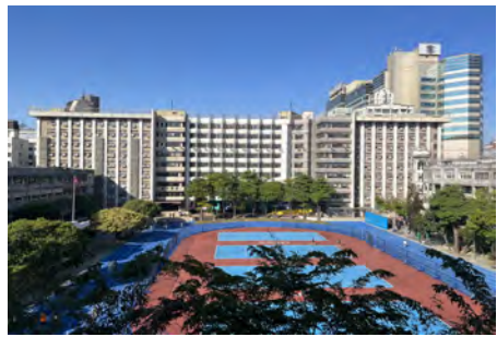
學生宿舍及運動場