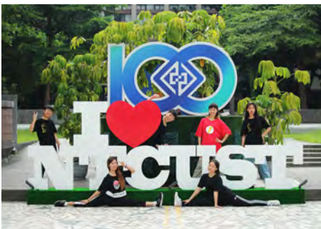
百年校慶裝置藝術