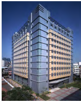
商學院綜合教學大樓