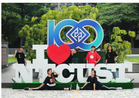
百年校慶裝置藝術