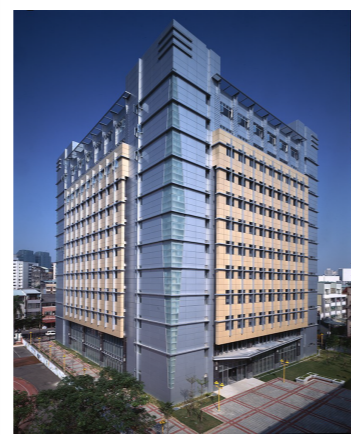
商學院綜合教學大樓