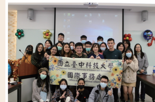
生活華語課程結業式