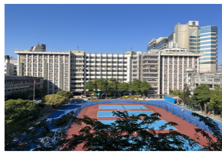
學生宿舍及運動場